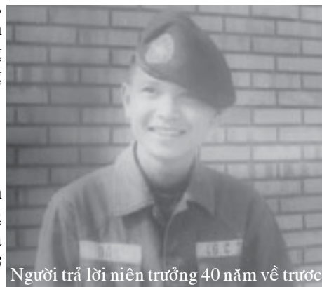
Người trả lời niên trưởng 40 năm về trước.

Tôi với niên trưởng có nhiều giao cảm, nên tập thơ “Vô Lượng Tình Sâu” của Niên Trưởng đến tay tôi bất ngờ, vào một chiều thứ bảy mưa bão. Nơi tôi ở là vùng đồi núi, nhìn núi đồi mờ mịt, mây mù quấn quanh những đỉnh núi, không hiểu tại sao tôi ... muốn khóc. Chưa mở tập thơ, chưa đọc một bài, chỉ mới nhìn hình bìa với hàng chữ “Vô Lượng Tình Sâu” tôi thấy lòng rưng rưng ... ! Tôi biết những lời thơ ở bên trong sẽ là ký ức ... đồng cảm với tôi. Cảm ơn Niên Trưởng đã gửi tặng “Vô Lượng Tình Sâu”.