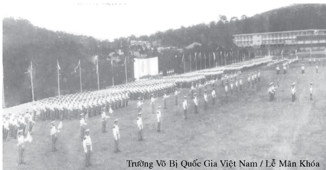
Trường Võ Bị Quốc Gia Việt Nam / Lễ Mãn Khóa

Chỉ nghe đến đó thôi cũng đủ cho các cựu SVSQ thấy những ngọn đuốc bập bùng, những vòng hoa bao quanh đài tử sĩ ở vũ đình trường Lê Lợi trong đêm truy điệu trước ngày mãn khóa, rồi: