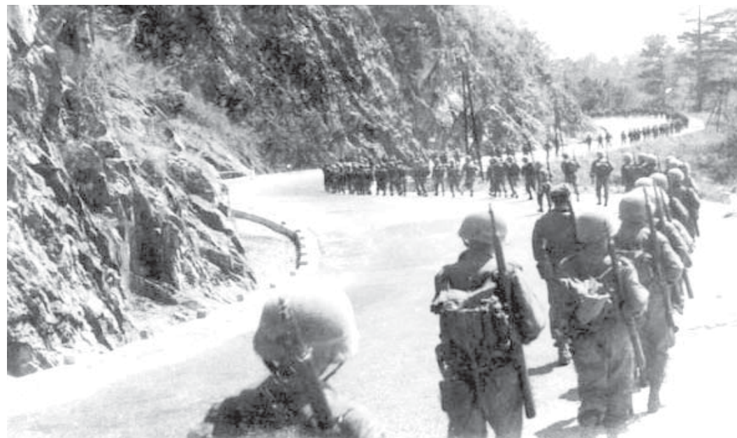
Trường Võ Bị Quốc Gia Việt Nam / Di Hành