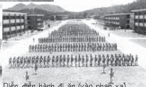
Diễn diễn hành đi ăn (vào phạn xá)