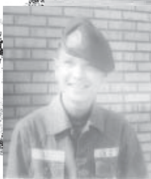
Đi học về