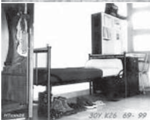
Phòng ngủ SVSQ