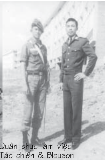
Quân phục làm việc Tác chiến & Blouson