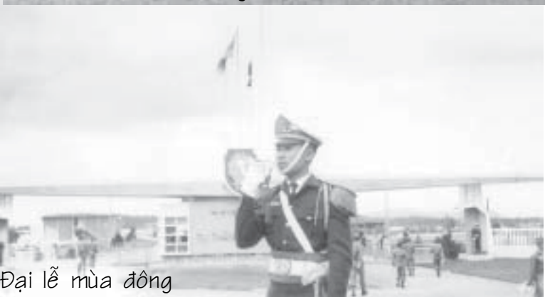
Đại lễ mùa đông